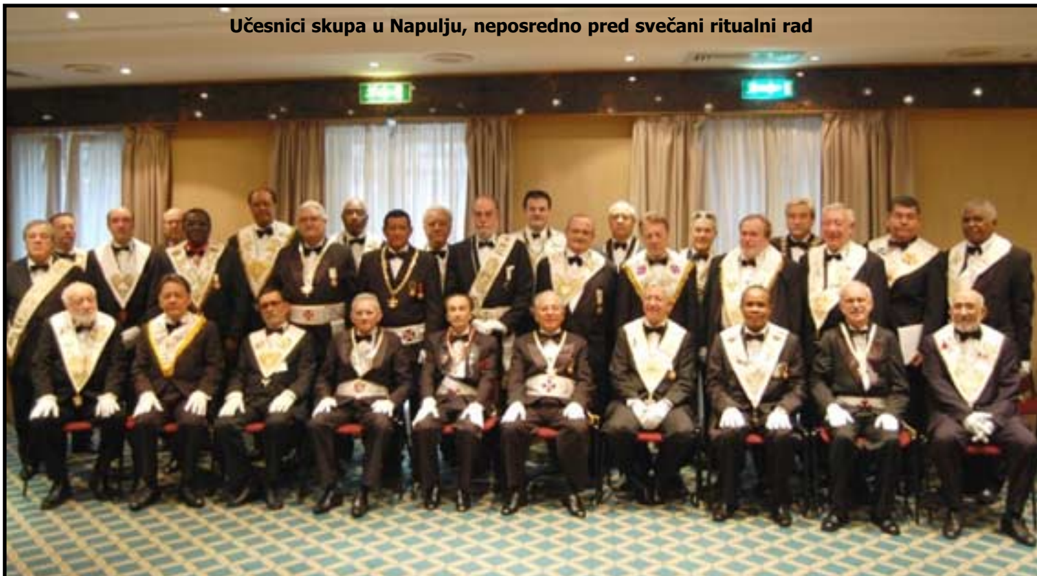
Učesnici skupa u Napulju, neposredno pred svečani ritualni rad