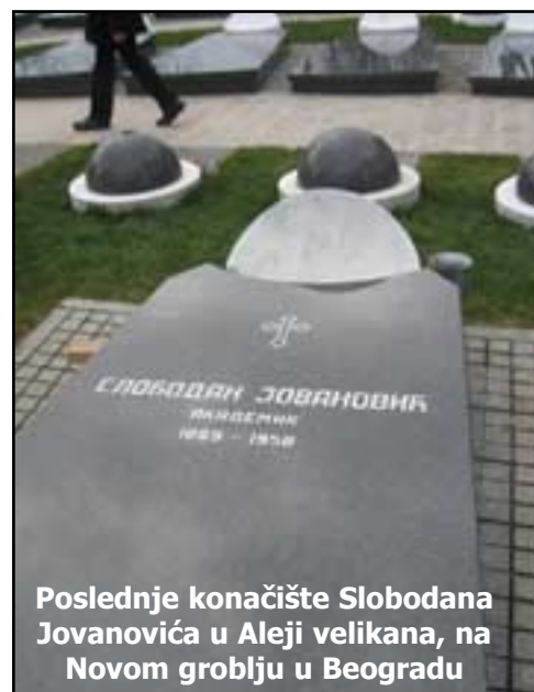
Poslednje konačište Slobodana Jovanovića u Aleji velikana, na Novom groblju u Beogradu

sceni kako u Jovanovićevo, tako i u ovo naše vreme. U celini posmatrano, Jovanovićevo rasprava o srp-