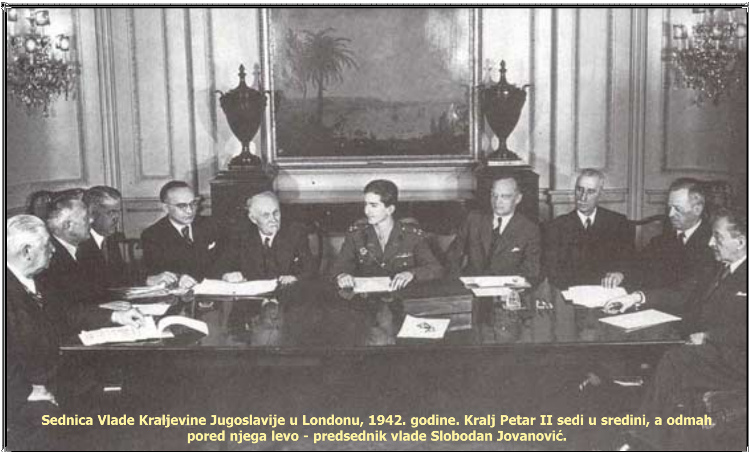
Sednica Vlade Kraljevine Jugoslavije u Londonu, 1942. godine. Kralj Petar II sedi u sredini, a odmah pored njega levo - predsednik vlade Slobodan Jovanović.

ga nisu slavili, nego su i njegovu staru slavu nastojali da izbrisu iz istorije i pamćenja. Iz svečane sale rektorata Beogradskog univerziteta u Kapetan Mišinom zdanju, gde su portreti svih bivših rektora, jedino je njegov portret izbačen iz te plejade. Pre nego što će se 1941. godine kobno i bespovratno sasvim otisnuti u politiku, posvršavaće, srećom, svoje najveće poslove. Završiće karijeru velikog profesora prava i objavljivanje svog velikog naučnog i književnog opusa sabranog u 17 knjiga.