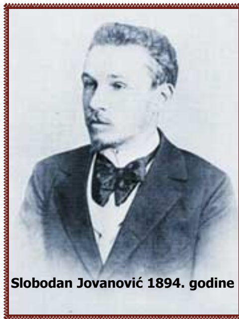
Slobodan Jovanović 1894. godine

Na žalost, ni posle smrti Slobodan Jovanović nije imao mnogo sreće sa svojim sunarodnicima. Ne samo što