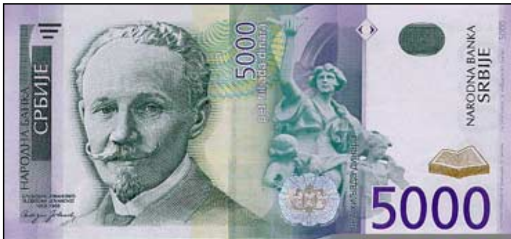
Lik Slobodana Jovanovića nalazi se na najvrednijoj srpskoj novčanici